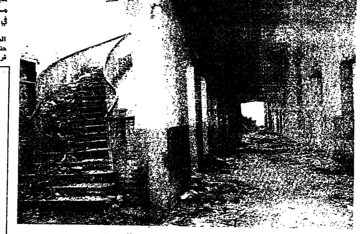
الدرج الممرور والبيشمير المغم

كما كانت تعتبرها في السابق نافذة من تاريخ النشر في الجريدة الرسمية. لكن الاثر على باب رئاسة الحكومة قد يصلح بالنسبة الى المراسيم ذات الطابع الاداري، لكنها لا تصلح للمراسيم التشريعية التي تتضمن قوانين وعقوبات، كالمرسوم الذي صدر بصدد قرش الرقابة على الصحف. وتعليقا، قال احد القضاة، انني كتلت في احد ايامي احدى الصحف، هل ادعه في مكتبي واذهب الى السراي الجديدة، لآقرأ نص القانون الذي سلكه على اساسه؟ من الادارات الحكومية التي عطلتها الاحداث، الجريدة الرسمية ... التي تطبق للقوانين والمراسيم الحكومية قوة النفاذ، والصفحة التشريعية لازمة، وبدونها لا يصح قانون نافذ ولا مرسوم صالحا للتطبيق. على ان الحكومة، وبصورة استثنائية عرضتها للظروف، ابتكرت طريقة جديدة لنشر المراسيم التي تصدرها مؤخرا، وهي نشر هذه القوانين على باب رئاسة الحكومة، واعتبرت هذه المراسيم نافذة من تاريخ نطقها على باب رئاسة الحكومة.